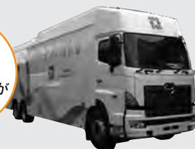
マンモグラフィと超音波装置を搭載した検診車