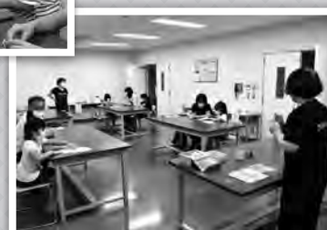
親子折り紙教室 風景▶