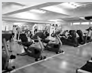
トレーニングジム