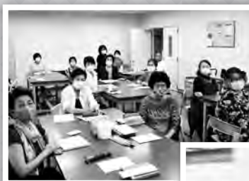
◀絵手紙体験教室 風景