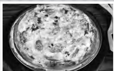
▲せせらぎのピザ作り