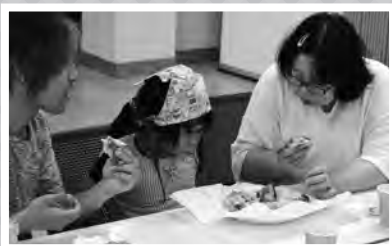
▲せせらぎのピザ作り 試食風景