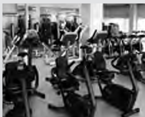
トレーニングジム