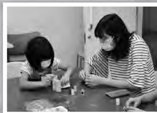
◀親子折り紙教室 風景