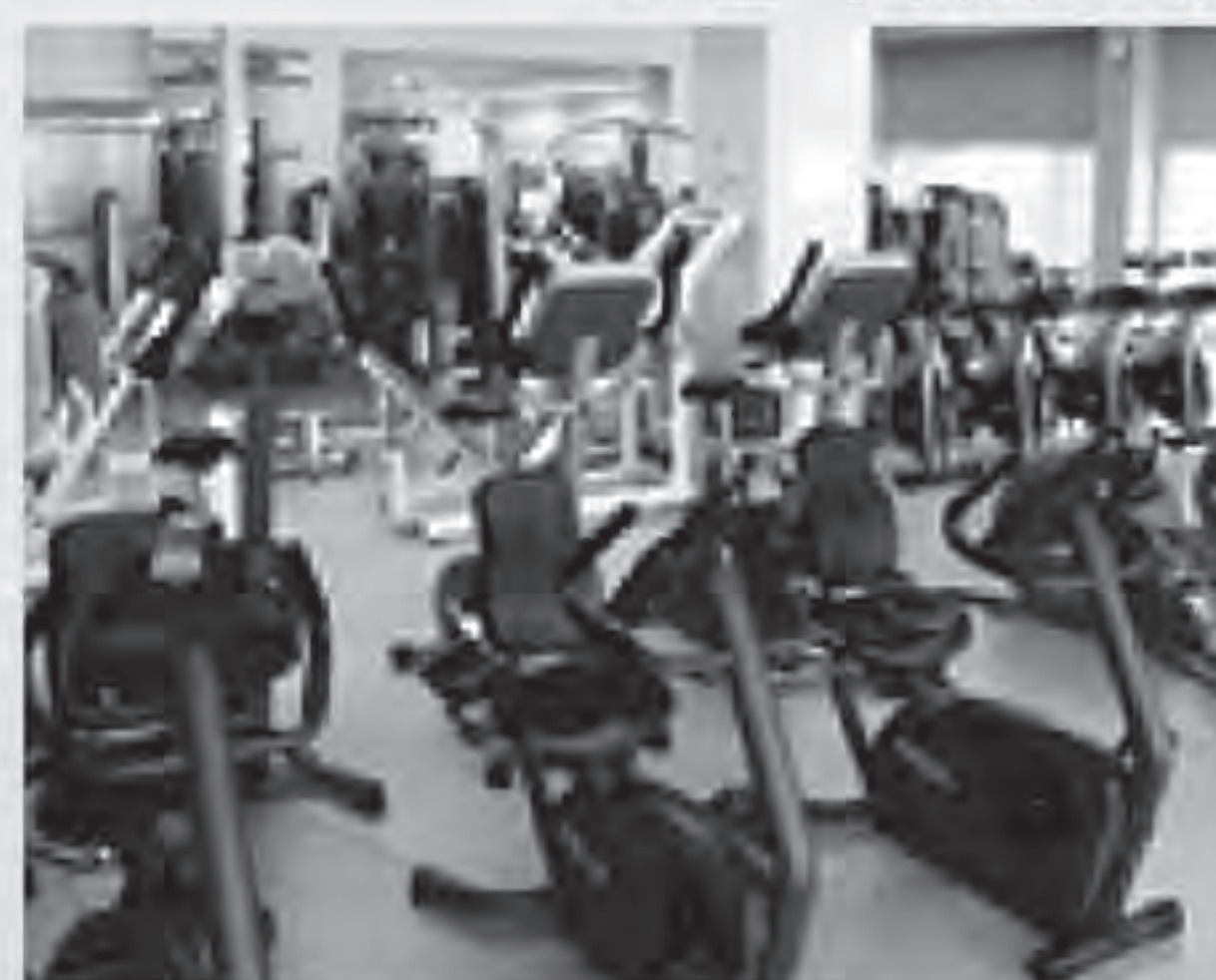
トレーニングジム