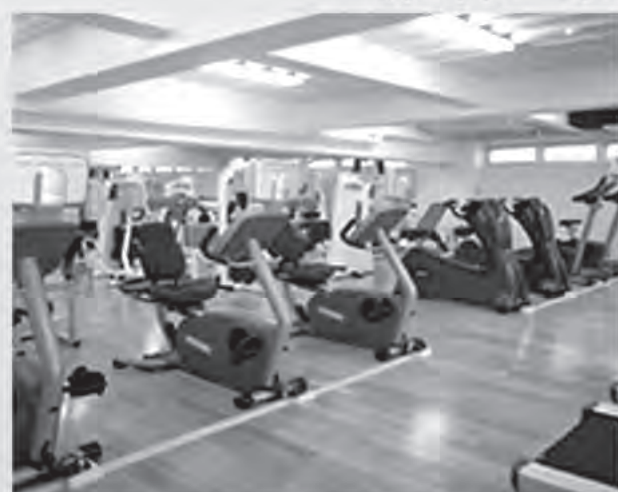
トレーニングジム